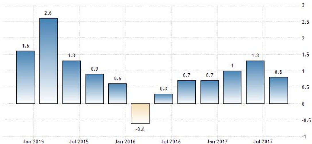
2015-2017 年南非 GDP 增长率

据南非统计局消息,2017 年前 9 个月与 2016 年前 9 个月相比较,南非经济增长 1%,2017 年第三季度未经调整的实际 GDP 同比增长了 0.8%,第三季度的名义 GDP 估计为 117 万亿里亚尔,根据前三季度数据,2017 年南非实际 GDP 增长极可能高于 0.5%的储备银行预期水平。并且,南非统计局还公布了 2017 年 8 月的贸易数据,出口环比上升 11%到 1034 亿兰特,进口环比增长 16.3%到 974 亿兰特水平。